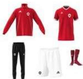
Sundby klubsæt, 5 dele børn

Akademi og talenthold betaler man ekstra for.